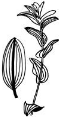
Le potamot plante indigène le grand herbier ouest