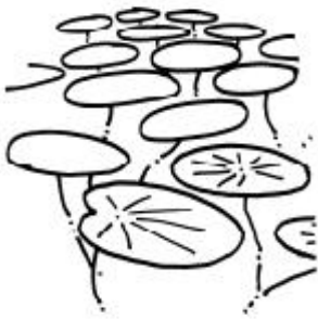
La brasséie plante indigène eau peu profonde