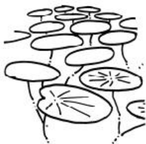
La brasséie plante indigène eau peu profonde